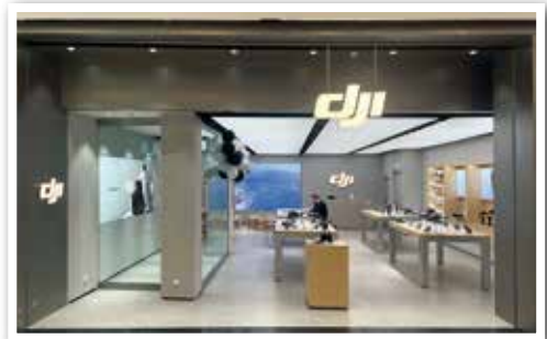
DJI Store in Ebene 0 Nähe Garden Plaza