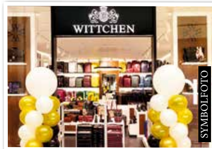
WITTCHEN bald neu in Ebene 1