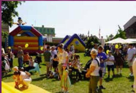
SA: Große Kinderwelt und Kinderdisco