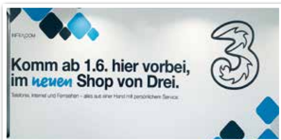
„3“ SHOP in Kürze neben MediaMarkt bei Eing. 10