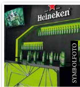
HEINEKEN Bar bald neu im Multiplex