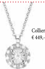
Collier € 449,-

Alle Artikel Weißgold 585 mit Brillanten