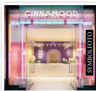
CINNAMOOD Nähe Eingang 4