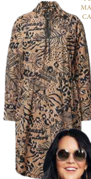
P&C MARC CAIN