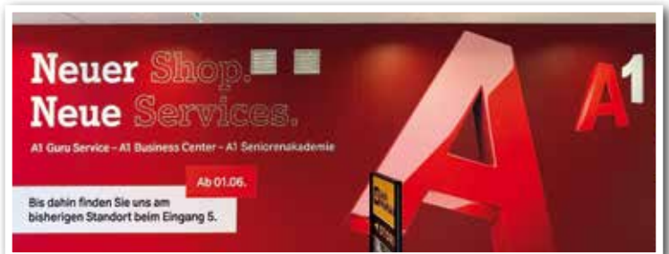
Auch der A1 SHOP übersiedelt von Eingang 5 in die obere Ebene