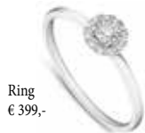
Ring € 399,-

Alle Artikel Weißgold 585 mit Brillanten