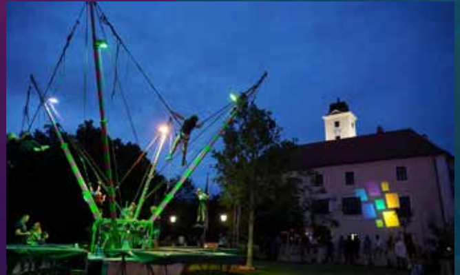
FR, SA & SO: Vergnügungspark mit Tagada, Autodrom, u.v.m.