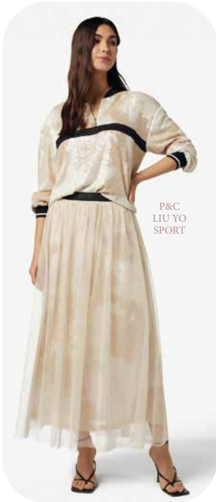
P&C LIU YO SPORT