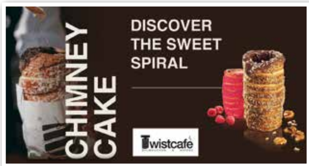
TWIST CAFÉ in Kürze neu im SCS Multiplex