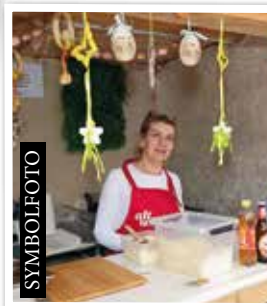
LANGOS QUEEN Eing. 5