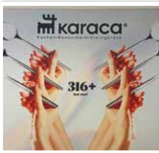
KARACA beim Water Plaza