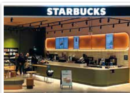
STARBUCKS Neueröffnung nach Komplettumbau bei Eingang 6