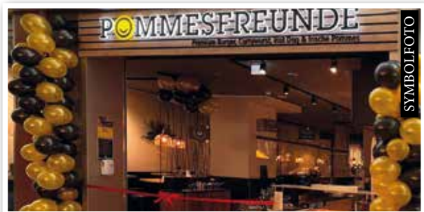
POMMESFREUNDE bald neu im SCS Food Court