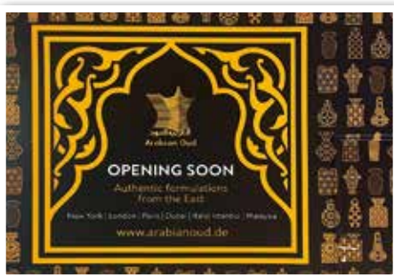
ARABIAN OUD bald neu bei Eingang 4