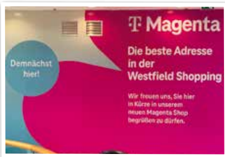
T-MOBILE - bald neu bei Eingang 10