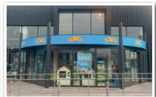
SMITH`S übersiedelte am SCS Nordring