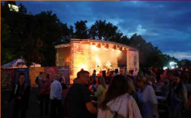
FR & SA: durchgehend Konzerte bis 23:00 Uhr