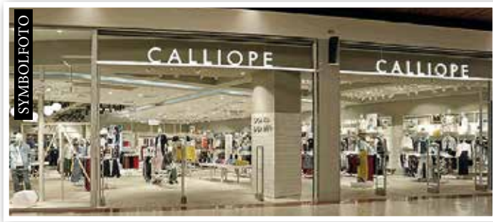
CALLIOPE in Kürze statt Terranova bei Eingang 6