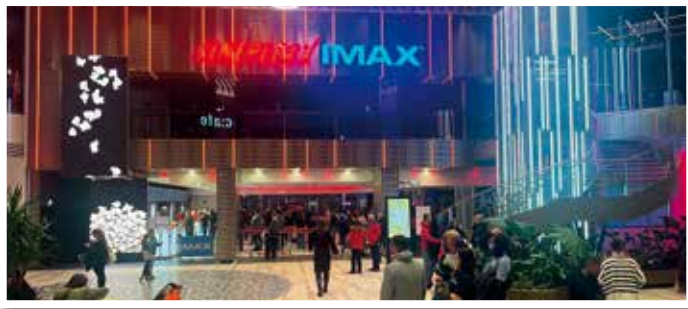
CINEPLEXX Westfield SCS im Multiplex