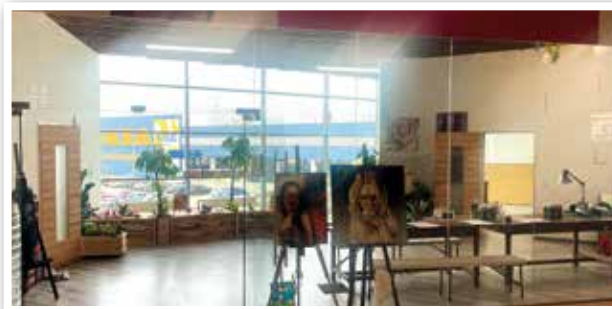
KUNSTSTUDIO COLORGROW neu im Multiplex