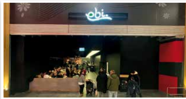
Restaurant „EBI“ neu im Multiplex Nähe Eingang 1