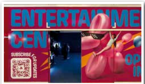
ENTERTAINMENT Center im Multiplex