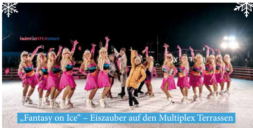
„Fantasy on Ice“ – Eiszauber auf den Multiplex Terrassen