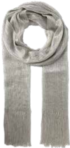
P&C CHRISTIAN BERG