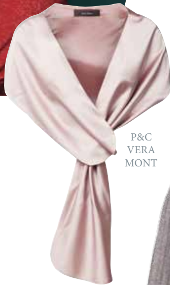
P&C VERA MONT