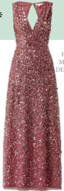
P&C MAYA DELUXE