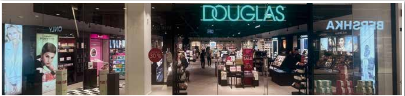
DOUGLAS eröffnete eine neue Filiale beim Garden Plaza - gegenüber der ehemaligen Geschäftsstelle