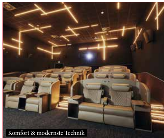
Komfort & modernste Technik