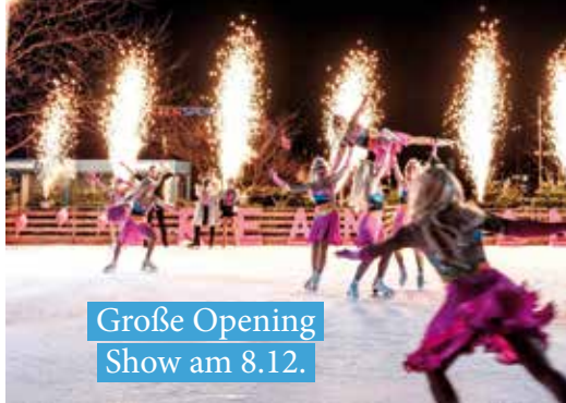
Große Opening Show am 8.12.

Zwischen 14:00 und 19:00 Uhr ist jeweils von Freitag bis Sonntag der Schlittschuhverleih geöffnet. Während der Semesterferien ist der Schlittschuhverleih von 13:00 bis 19:00 Uhr geöffnet. Westfield Club Mitglieder zahlen keine Leihgebühr, für andere Besucher*innen werden dafür € 5,- in Rechnung gestellt.