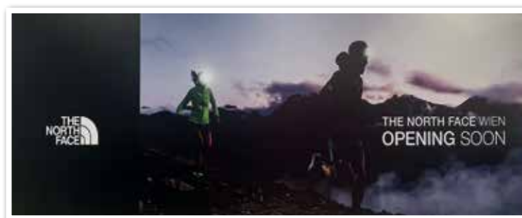
THE NORTH FACE neu neben Primark