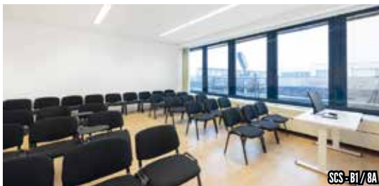
SCS - B1/8A