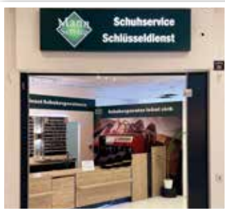
MANN Service bei P3