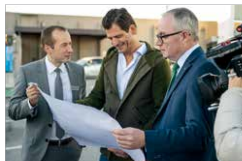
31 PV-ÜBERDACHUNG DER SCS PARKPLÄTZE