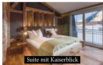
Suite mit Kaiserblick