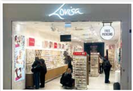
LOVISA - neu Nähe Water Plaza