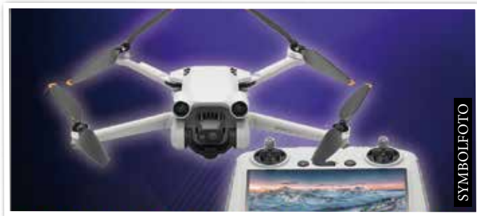
DJI Store kommt in Ebene 0 Nähe Garden Plaza