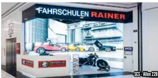
SCS - Allee 228