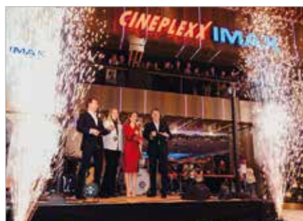
27 CINEPLEXX WEST-FIELD SCS ERÖFFNUNG