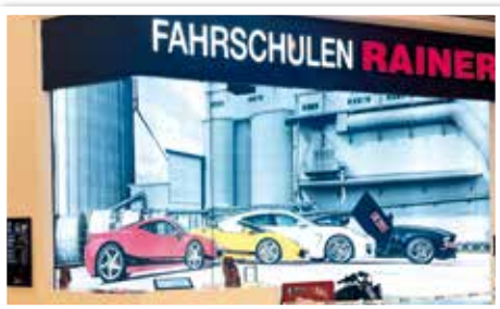
FAHRSCHULEN RAINER neu bei Eing. 4