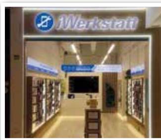
iWERKSTATT Store - G380