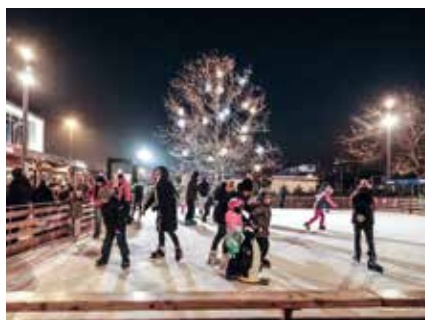
29 MULTIPLEX ON ICE SCS-EISLAUFPLATZ