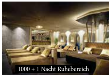
1000 + 1 Nacht Ruhebereich