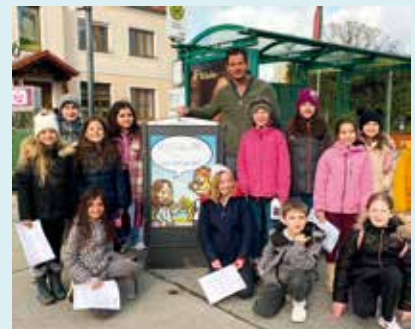
Die Mitglieder des Kindergemeinderates mit Bürgermeister Hannes Koza und der neuen „Citybox“

Die erste „Legislaturperiode“ des Kindergemeinderates kann als Erfolg angesehen werden und rief durchwegs positive Reaktionen hervor. Das Projekt soll daher in der Zukunft vorangetrieben und weiterentwickelt werden.