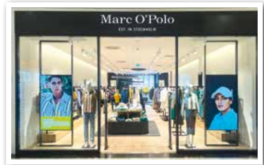
MARC O'POLO eröffnete Nähe Eingang 8