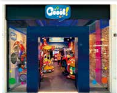
KIDDIELAND neu in Ebene 1