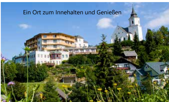
Ein Ort zum Innehalten und Genießen

Genießerhotel Alpin, Seestraße 35, 6215 Achenkirch, Tirol T: +43 (5246) 6800 | E: hotel@kulinarikhotel-alpin.at