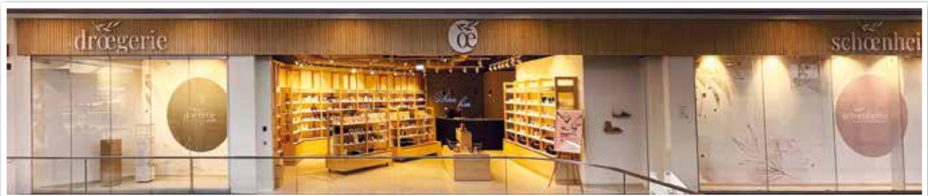
SCHOENHEITSORDI und DROEGERIE neu in Ebene 1 Nähe Water Plaza - Eingang Parkdeck 3