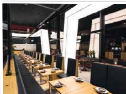
Ab Herbst: „All-You-Can-Eat but a la Carte“ Konzept von „EBI“ im Multiplex