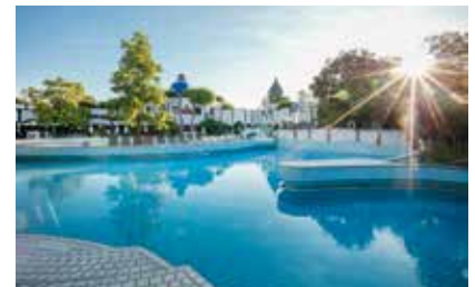
Foto: Rogner Bad Blumau