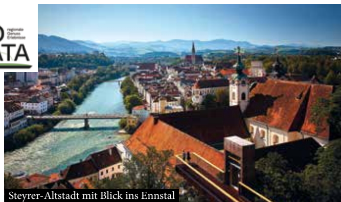
Steyrer-Altstadt mit Blick ins Ennstal