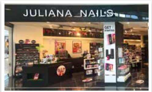
JULIANA NAILS übersiedelt Nähe Eing. 4