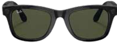
RAY-BAN STORIES WAYFARER € 329,00

Halte die Welt fest, wie du sie siehst! Neben styli-scher Vielfalt und einem enormen Markensortiment bringt Pearle jetzt auch die neueste Sonnenbrillen Technologie auf den Markt. Ray-Ban Stories Wayfarer verbindet dein Smartphone mit dem zeitlosen Gestell, damit du deine Abenteuer festhalten und teilen kannst. Nimm Fotos und Videos freihändig auf und lebe den Moment so wie er ist.