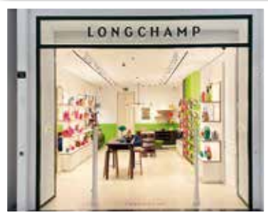
LONGCHAMP neu in Ebene 1