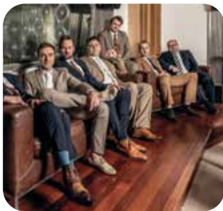
Hot Pants Road Club

In den Sommermonaten stehen die Multiplex Terrassen wieder für Outdoor-Vergnügen zur Verfügung. Stargäste wie LEMO, Chris Steger, der Hot Pants Road Club und noch viele mehr sorgen diesen Sommer für Unterhaltung auf den Multiplex Terrassen. Für kulinarische Verwöhnung werden die Gastrobetriebe des Multiplex sorgen.