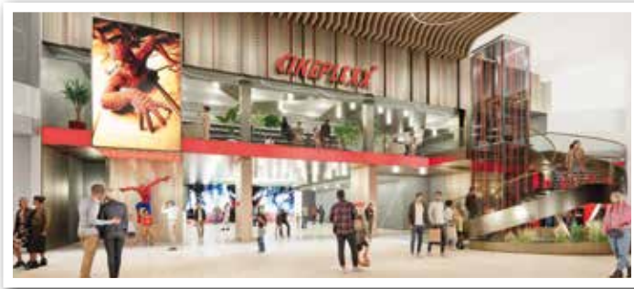
CINEPLEX Kinocenter NEU ab Dezember im Multiplex