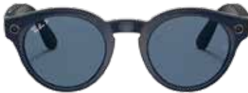
RAY-BAN STORIES ROUND € 359,00