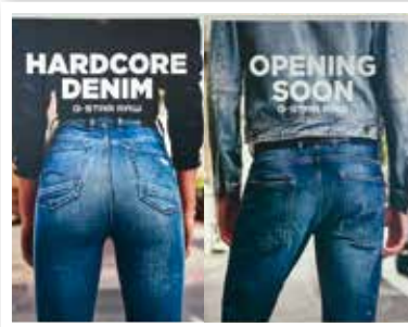
G-STAR neu Nähe Eingang 5