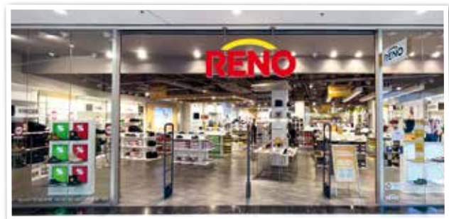
RENO eröffnete nach Umbau neu - Nähe Eingang 6