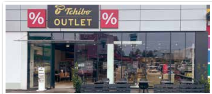
TCHIBO OUTLET NEU am SCS-Nordring