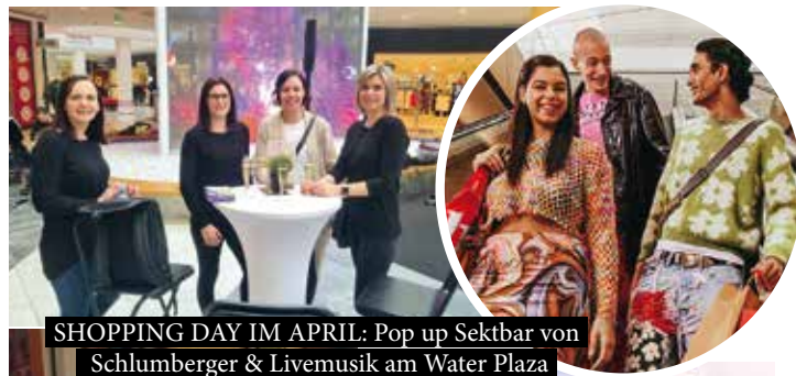
SHOPPING DAY IM APRIL: Pop up Sektbar von Schlumberger & Livemusik am Water Plaza

Auf Mitglieder unseres Westfield Clubs* wartete am Shopping Day ein prall gefüllter Goodie Bag mit kleinen Präsenten toller Marken (z.B. Schlumberger, Demmer's, Ikea, Lindt, Biotherm, SimpliTV, BIPA oder Dr. Beckmann). Die Geschenk-Taschen wurden am Water Plaza verteilt.