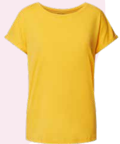
CHRISTIAN BERG / P&C