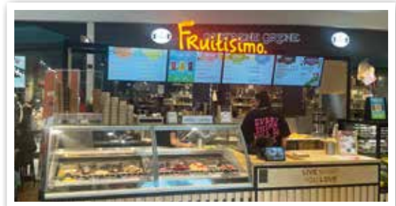
FRUTISIMO neu Nähe PRIMARK in Ebene 1