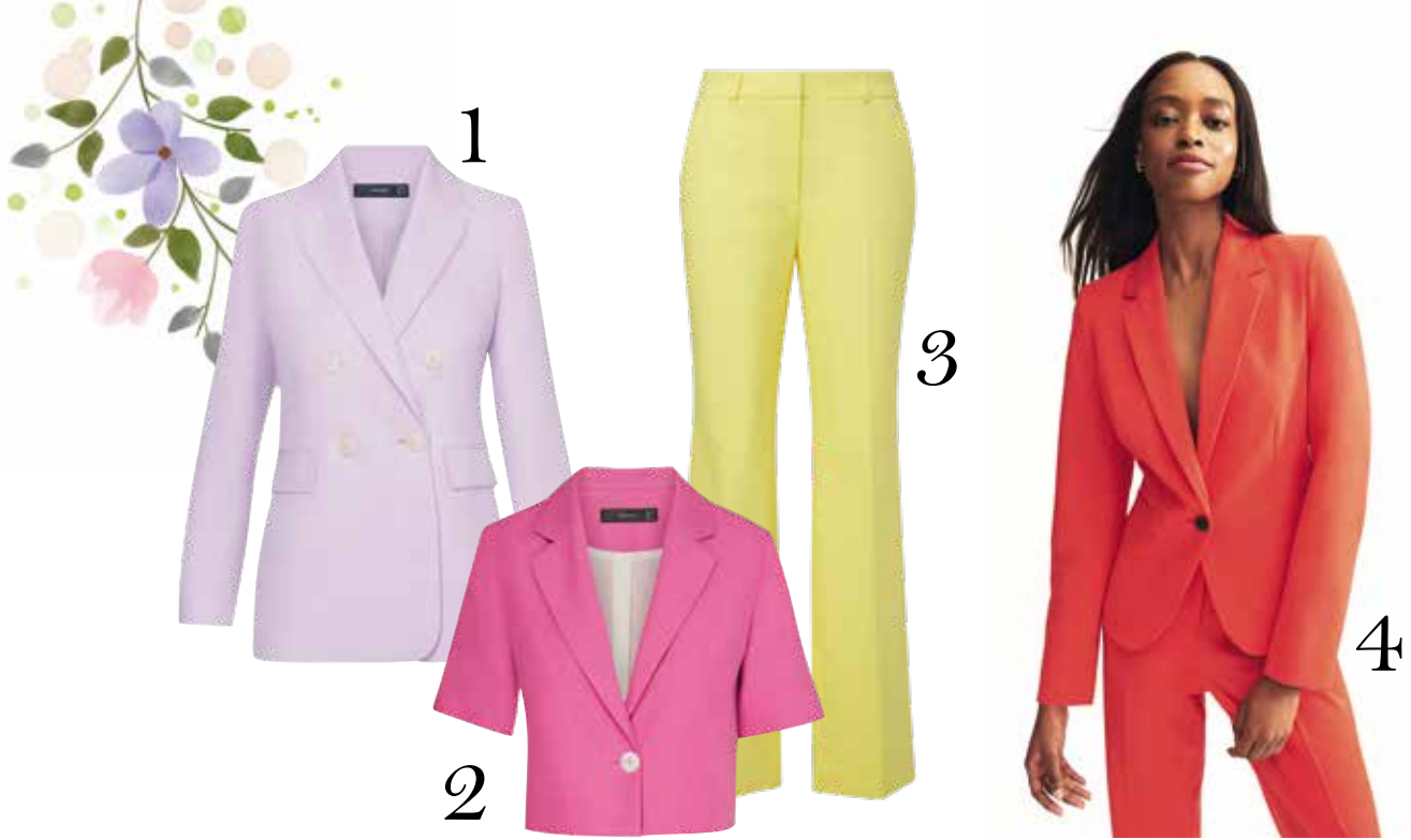
*1 Blazer Hallhuber € 160,- *2 Blazer Hallhuber € 140,- *3 Hose Comma € 99,99 *4 Look by C&A