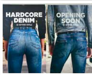
G-STAR bald Nähe Eingang 5