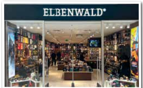
ELBENWALD neu bei Eingang 3