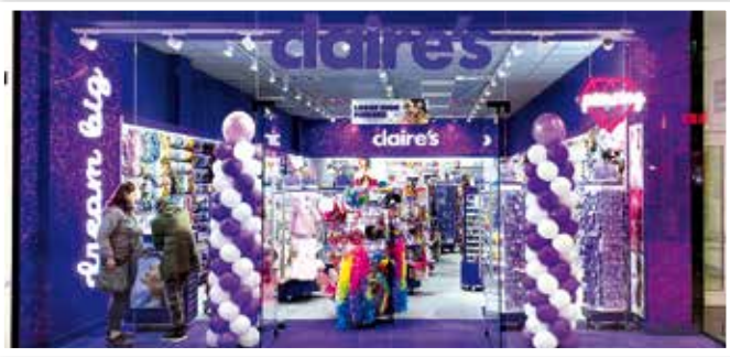
CLAIRE's eröffnete neu in Ebene 1 Nähe Primark