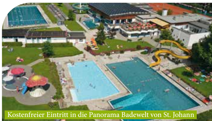
Kostenfreier Eintritt in die Panorama Badewelt von St. Johann