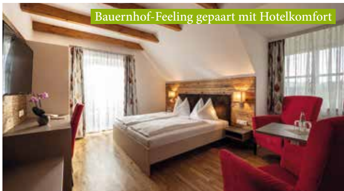
Bauernhof-Feeling gepaart mit Hotelkomfort

Ballonhotel Thaller**** , Hofkirchen 51, 8224 Kaindorf Tel.: +43 3334 2262, office@ballonhotel.at, www.ballonhotel.at