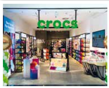
CROCS neu Nähe Garden Plaza