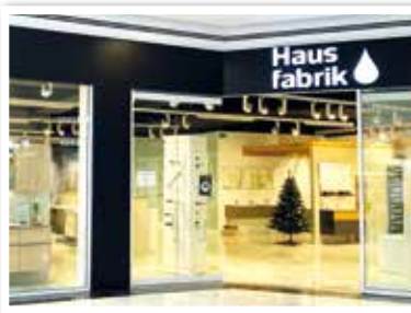
HAUSFABRIK bei Eingang P3