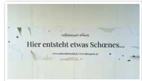
SCHÖNHEIT2GO neu in Ebene 1 Nähe P3