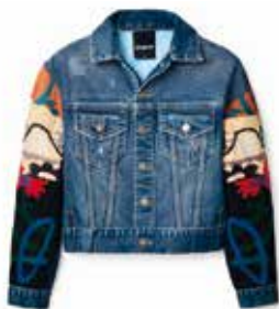
Trucker-Jeansjacke Ethno-Look € 189,00