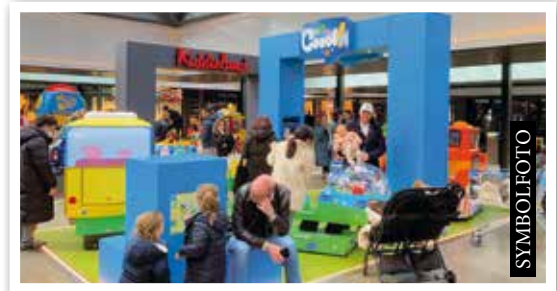
KIDDIELAND eröffnet in Kürze in Ebene 1