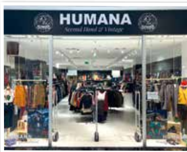
HUMANA bei Eingang 3