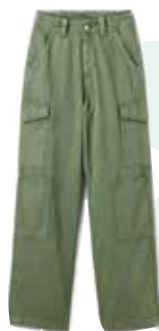
Lange Cargohose € 99,95