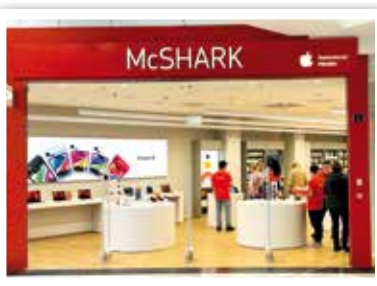
McSHARK neu Nähe Eingang 10