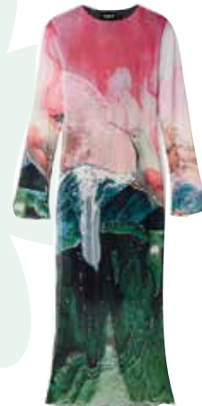
Midikleid Slim Fit Tüll Fantasie € 119,00