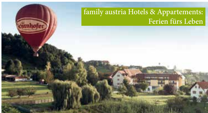
family austria Hotels & Appartements: Ferien fürs Leben