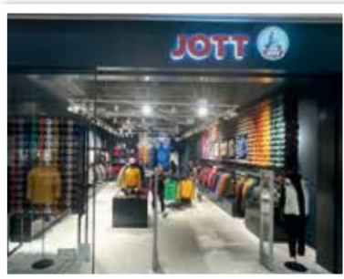
JOTT neu in Ebene 1 - Nähe P&C