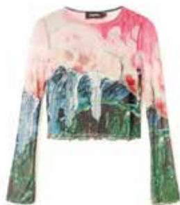
Kurzes Shirt Slim Fit Fantasie € 59,95