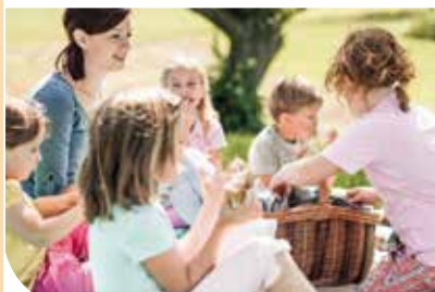
„Lufti“ Kinderclub - und Stubenbergsee nur 6km entfernt - ideal für Familien