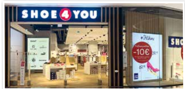
SHOE4YOU übersiedelt in Ebene 1 - Nähe Eingang 6