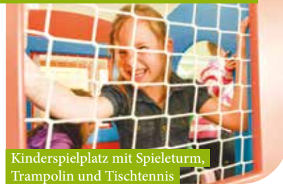
Kinderspielplatz mit Spielturn, Trampolin und Tischtennis

Familienhotel Central, Taxaweg 5, 6380 St. Johann in Tirol, Tel.: +43 5352 6220 7620 info@familienhotel-stjohann.com, www.familienhotel-stjohann.com