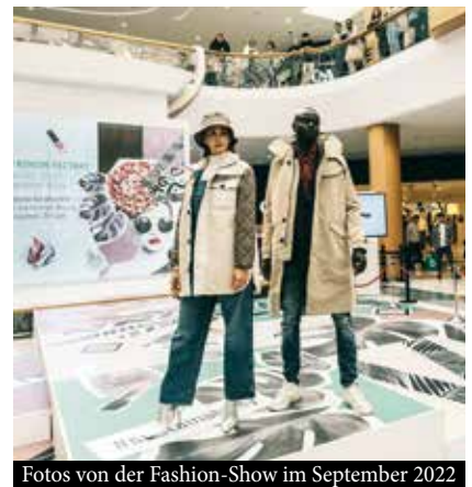
Fotos von der Fashion-Show im September 2022

Anlässlich der neuen Spring/Sommer Kollektionen unserer Fashionstores lädt die Westfield Shopping City Süd am 25. März 2023 zur Frühlings-Fashion Show. Lassen Sie sich von den neuen Frühlingstrends und Looks zahlreicher Fashion-Partner und Modemarken der SCS inspirieren, die am Einkaufsamstag für vielfältige Gelegenheiten präsentiert werden.