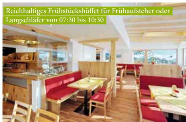
Reichhaltiges Frühstücksbuffet für Frühaufsteher oder Langschläfer von 07:30 bis 10:30