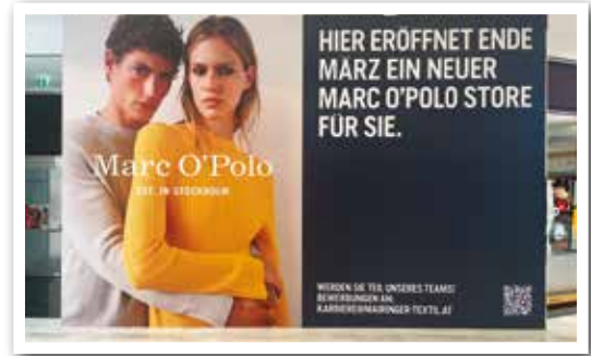
MARC O'POLO eröffnet Nähe Eingang 8