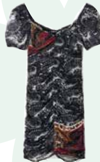
Kurzes Kleid Raffung Paisley € 119,00