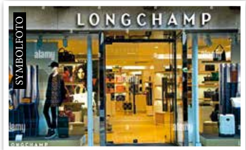
LONGCHAMP in Ebene 1 - Garden Plaza