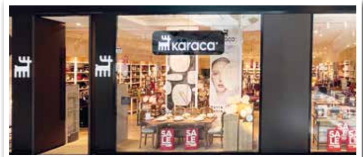
KARACA eröffnete neu in Ebene 1 am Garden Plaza